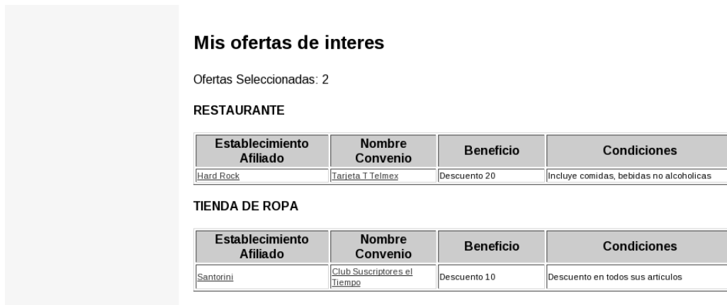
Ilustración 5: Programación de Ofertas de interes

Tenga a mano esta impresión pues le ayudará a tener presente en cuales establecimientos afiliados puede obtener descuentos al hacer uso de sus tarjetas de beneficios y descuentos.