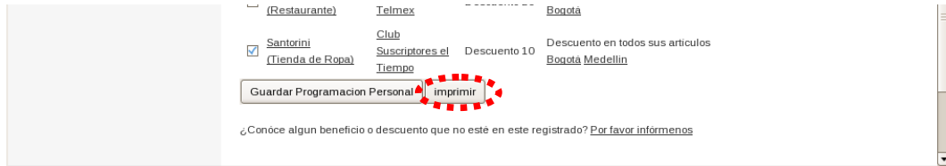
Ilustración 5: Imprima su programación

De clic al botón Imprimir , con el fin de imprimir su programación personal.